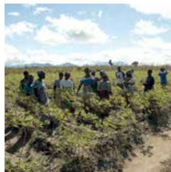
Undervisning i kasavamark.